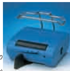
Ножное устройство 9970 со скобой (принадлежности).

MF-PERFECTA может поставляться как настольное, коленное и ножное устройство.