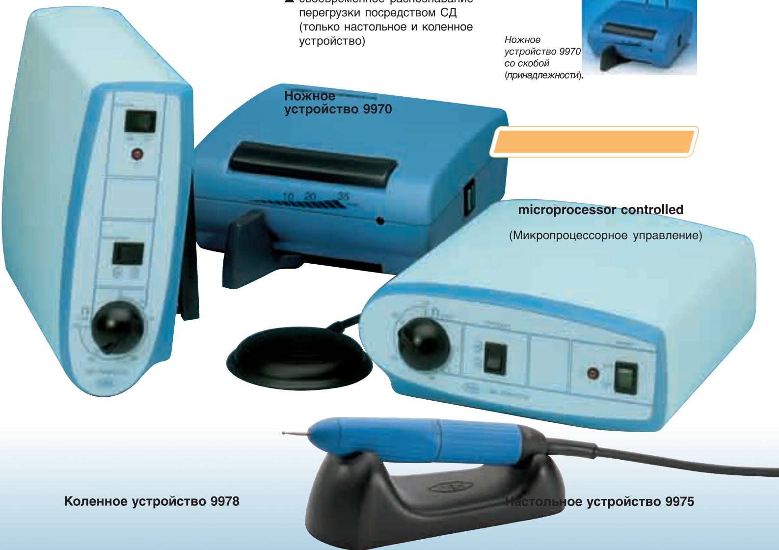
Коленное устройство 9978