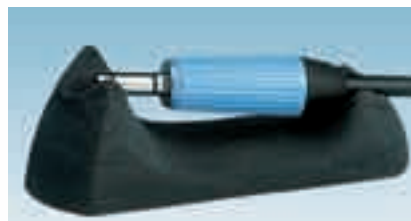
Электромотор с уложением для держателя.