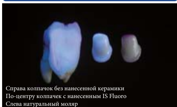
Справа колпачок без нанесенной керамики По-центру колпачек с нанесенным IS Fluoro Слева натуральный моляр